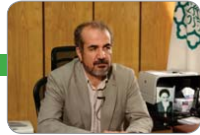
عبدالرضا گلیایگانی، معاون شهرسازی و معماری شهرداری تهران