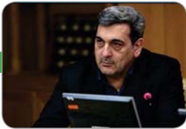
پیروز حناچی، شهردار تهران